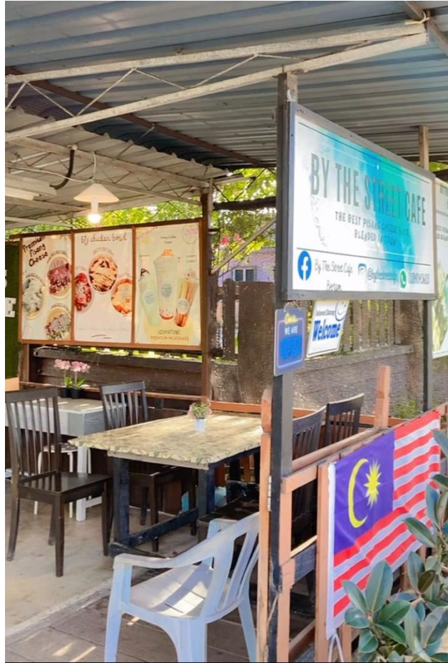
Di hadapan kedai By the Street Cafe